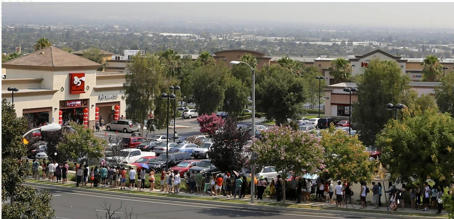
奇諾崗店, 加州 2013年7月